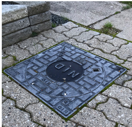
Brønddæksel i forhaven med fliser