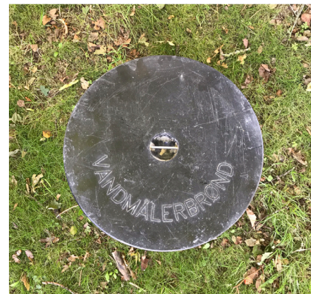
Brønddæksel i forhaven med græs