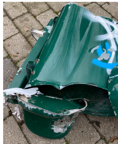
Affaldsbeholderen ved SØ 51/53