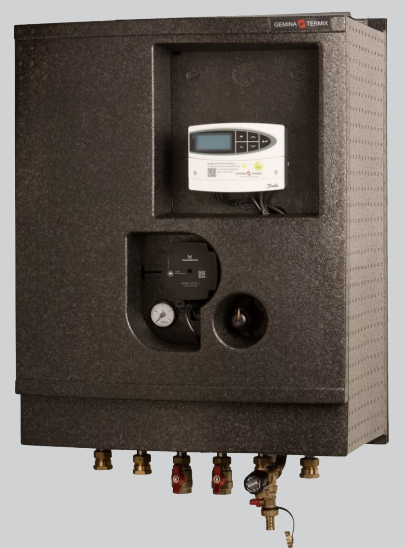
Fjernvarmeanlægget måler: h 800 x b 530 x d 375mm