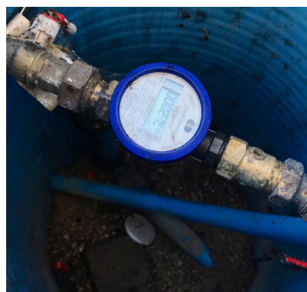
Et kik ned i en målerbrønd

I skrivende stund ved vi ikke, hvornår der bliver etableret målerbrønde på alle matriklerne i Søagerparken.