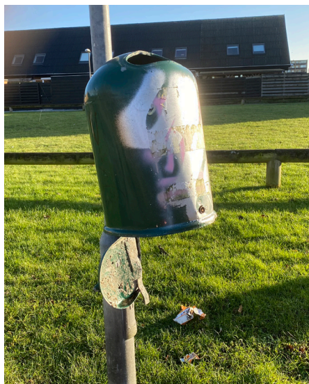
Affaldsbeholderen ved boldbanen

Det lykkedes os at fjerne den orange maling.