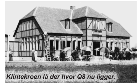
Klintekroen lå der hvor Q8 nu ligger.

Efter at flygtningestrømmen tog noget af, blev der sejlet med kurértransport til Sverige fra Mosede Havn.