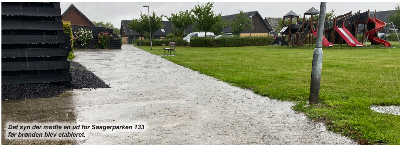
Det syn der mødte en ud for Søagerparken 133 før brønden blev etableret.