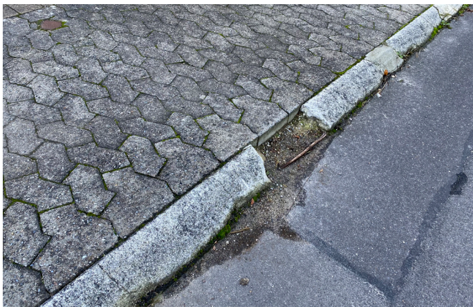
Eksempel på et ødelagt fortov i Hedelyhaven.

Husene i Hedelyhaven har alle parkering i forhaven. For at komme til parkeringen i forhaven skal et fortov med høj kantsten passeres.