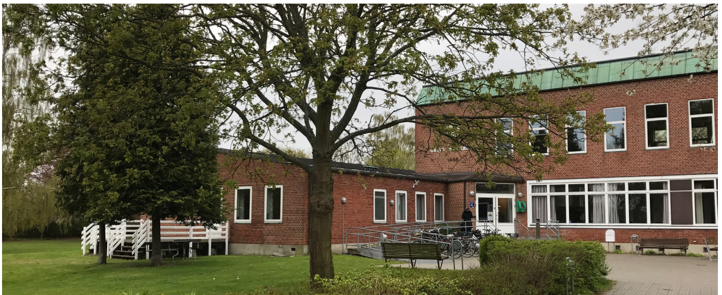
Regnskabsgeneralforsamlingen holdes, som sædvanlig, i Greve Borgerhus, Greveager 9.