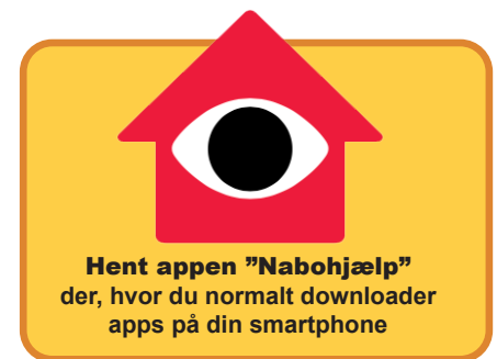
Feriesedlen er et af de værktøjer du kan finde på Nabohjælps hjemmeside