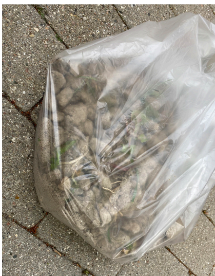
Vi fjernede en halv sæk fuld kattermæg

I mellemtiden vil vi råde forældre og bedsteforældre til at sørge for, at børn ikke putter sandet i munden, og at de vasker hænder, når de kommer hjem.